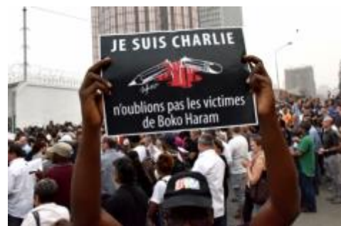
Figuur 4: de #CharlieHebdo van Nigeria.

Maar aan de op één na dodelijkste terreuraanslag in de recente wereldgeschiedenis werd veel minder aandacht besteed (figuur 4). Het komt weliswaar wel in het nieuws, maar vele