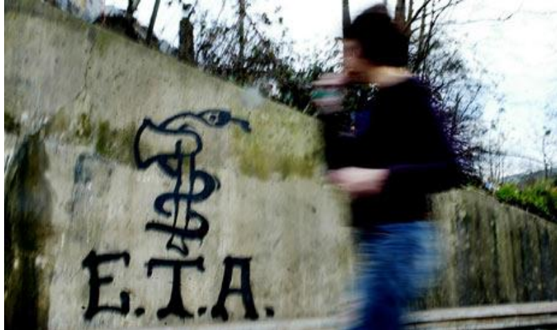
Figuur 2: Een voorbeeld van de propaganda van de ETA

Na de Burgeroorlog, die eindigde in 1939, werden de maatregelen tegen de Basken niet ingetrokken, maar zelfs geïnstitutionaliseerd. Dat wil zeggen dat deze maatregelen zelfs in de wet kwamen. De Baskische taal werd verboden en uitingen van de Baskische cultuur en gebruiken werden onderdrukt. De Basken kregen zelf het idee dat