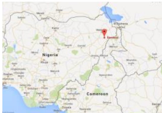
Figuur 7: Grensstreek Kameroen en Nigeria, bij het rode puntje ligt het Sambisa bos