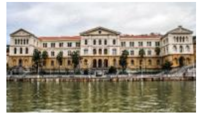
Figuur 4: Universiteit van Deusto

Vanaf de jaren '50 van de vorige eeuw belandden de Basken in een situatie van culturele homogenisering, het ontstaan van steeds minder verschillen in een cultuur en onderdrukking. Dictator Franco probeerde de nationalistische gevoelens van de Basken de kop in te drukken. Zo mochten zij hun eigen taal, het Euskera, niet meer in het openbaar spreken en nam hij meerdere Baskische intellectuelen gevangen. Als reactie op deze onderdrukking richtte