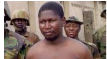
Figuur 9: Mohammed Yusuf

Mohammed Yusuf (figuur 9) is een erg charismatisch leider en hij reist stad en land af om jongeren te mobiliseren. Hij preekt overal waar mogelijk en zijn kritiek op onder andere de Nigeriaanse overheid en de armoede slaat aan onder schoolverlaters, werkloze jongeren en scholieren. Onder Yusuf werd Boko Haram enorm populair, bijna een soort cult.