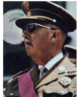
Figuur 1: Francisco Franco

In 1910 studeert Franco af als luitenant en in 1912 gaat Franco meevechten met het Spaanse bezettingsleger in Marokko. Franco was een middelmatige student geweest: uiteindelijk verlaat hij de academie als nummer 251 op de ranglijst van 312 studenten. Alleen op het slagveld zal Franco deze positie kunnen verbeteren: de enige kans hiervoor ligt in Marokko. In Marokko maakt Franco snel carrière: kapitein in 1915, commandant in 1917, kolonel in 1925 en een jaar later is Franco zelfs generaal. In Marokko ontwikkelt Franco ook zijn politieke ideeën, die ultraconservatief zijn: Militairen zijn superieur aan politici, het is het leger dat de eenheid van Spanje waarborgt en het is het leger dat het politieke lot van Spanje dient te bepalen. 1