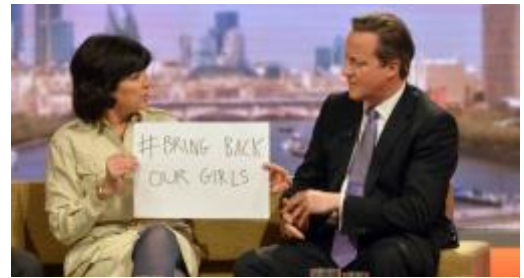
Figuur 5: #BringBackOurGirls . Links Christiane Amanpour, rechts David Cameron

Zoals eerder genoemd werd de wereld eigenlijk pas wakker geschud op het moment dat Boko Haram in 2014 zo'n 276 meisjes uit hun school in Chibok kidnapte. Dat is het moment waarop mensen beseften dat Boko Haram 'echt' is en dat ze wel degelijk kracht hebben. Voor veel mensen was het niet meer alleen een probleem voor Nigeria, het wordt nu ook gezien als een probleem waar wij als Westerlingen een verandering in konden brengen. Er werd een massale hulpactie in het leven geroepen vanuit de Westerse wereld, namelijk #BringBackOurGirls (figuur 5). De actie is begonnen in de VS maar is nu wereldwijd verspreid. De organisatie wil ervoor zorgen dat mensen het besef krijgen van de situatie en dat de overheden gaan helpen met het herstellen van de situatie in Nigeria.