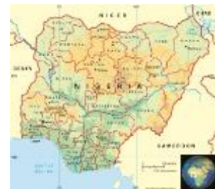
Figuur 7: Nigeria

In Nigeria (figuur 7) bestaat al jarenlang een tweedeling als het op religie neerkomt. Het land valt ruwweg uiteen in Noord en Zuid 14 . In het Noorden wonen de Hausa/Fulani, een Nigeriaanse bevolkingsgroep, die al zo'n duizend jaar de islam aanhangen. In het Zuiden overheerst het christendom: de Yoruba en de Igbo, dit zijn de christelijke Nigeriaanse bevolkingsgroepen, zijn in de negentiende en twintigste eeuw gekerstend. Onder Brits koloniaal bestuur werden deze sterk van elkaar verschillende gebieden samengevoegd tot het hedendaagse Nigeria. In 1960 werd de Federatie Nigeria formeel onafhankelijk, hoewel de Hausa/Fulani dit in eerste instantie niet wilden zijn.