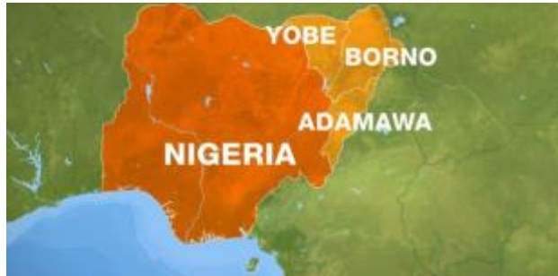
Figuur 6: Nigeria en Borno, Yobo en Adamawa. De gebieden waar Boko Haram het sterkst was

bepaald geldbedrag wilde de regering soms alle acties van Boko Haram wel onder het tapijt vegen. Deze afwezigheid van contraterrorisme heet coöptatie, hier wordt samengewerkt met de terroristische organisatie voor bijvoorbeeld geld. 34