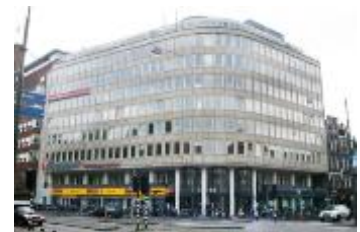
Figuur 3: Aurora gebouw Amsterdam

In Nederland zijn twee bomaanslagen gepleegd die door de ETA geclaimd zijn. Deze vonden op 30 juni 1990 en op 8 juli 1990 plaats in Amsterdam bij het Aurora-gebouw (figuur 3) en bij een pand aan de Herengracht. In deze gebouwen waren een Spaanse luchtvaartmaatschappij en een agentschap van de Spaanse Bank Bilbao Vizcaya gevestigd. 41 Ook in Nederland is het de ETA verder niet gelukt om invloed uit te oefenen. Vraag een gemiddelde volwassene eens naar hun kennis over de ETA, en je zult of te horen krijgen dat ze niet precies weten wat het inhoudt, of het is 'die ene afscheidingsbeweging daar in Spanje, in Baskenland'.