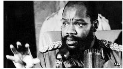
Figuur 8: Chukwuemeka Ojukwu

In 1966 pleegden officieren van de Igbo, de christenen, een militaire coup die een einde maakte aan de Federatie Nigeria. De coupplanners verklaarden een 'levensvatbare staat te willen bevorderen', boven de bevoordeling van stammen, waardoor met name de Hausa-stammen, de moslims, zich bedreigd voelden. Hierom volgde op 29 juli 1966 een tegencoup. Vele Igbo's vluchtten op dat moment naar het Zuidoosten, waar rebellenleider Ojukwu (figuur 8) op 26 mei 1967 de republiek Biafra 15 uitriep. De reactie van de Federale Militaire regering hierop was alles behalve mild. Generaal-majoor Yakubu Gowon, president van Nigeria van 1966 tot 1975, kondigde de algemene mobilisatie af, blokkeerde de oostelijke havens en dreigde met economische sancties. Daarop brak de Biafra-oorlog uit, die tweeënhalf jaar later, in januari 1970, pas ten einde kwam.