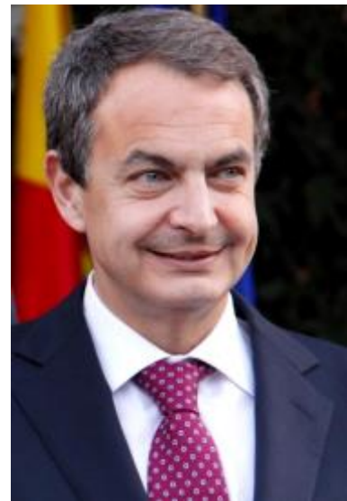
Figuur 4: José Luis Rodríguez Zapatero

Na de aanslagen op de Madrileense treinen op 11 maart 2004, die in eerste instantie door de regerende Partido Popular aan de ETA toegeschreven werd, maar in werkelijkheid gepleegd waren door militante moslims die banden hadden met Al Qaida, won de PSOE van José Luis Rodríguez Zapatero (figuur 4) de verkiezingen, die drie dagen na de aanslagen werden gehouden. Zapatero was degene die ruim een jaar later de eerste stap zette richting onderhandelingen met de ETA en Herri Batasuna. Hier is te zien hoe de democratische aanpak van de overheid begon door te schemeren, in plaats van een oorlog te voeren tegen deze terroristische organisatie. Het duurde daarna echter nog tien maanden voordat de ETA reageerde op de voorstellen van Zapatero en een staakt-het-