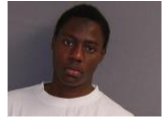
Figuur 6: Umar Farouk Abdulmutallab

Wat misschien wel de meest kenmerkende angst blijft van de Westerse bevolking, is dat moslims in West-Europa zullen radicaliseren of dat er zich onder de toenemende vluchtelingenstroom geradicaliseerde terroristen bevinden die een aanslag voor ogen hebben in Europa.