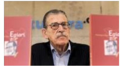
Figuur 5: Julen Madariaga

Medeoprichter van de ETA Julen Madariaga (figuur 5) zei hierover: “Je werd gearresteerd en mishandeld als je de Baskische taal in het openbaar gebruikte”. De reactie van het militaire regime bracht de ontwikkelingen van de ETA in een stroomversnelling: de strijders voelden zich veel eerder genoodzaakt over te stappen op de militaire strijd. 11