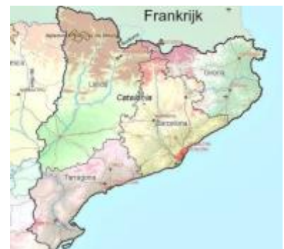
Figuur 2: Kaart van Catalonië

Zowel het leger van de republikeinen als het leger van de nationalistenvan begon een massaleger op te bouwen. Veel soldaten kwamen in het republikeinse 'Volksleger' terecht, dat zeer gedisciplineerd en hiërarchisch was. Franco kreeg echter steeds meer hulp vanuit het buitenland: de Duitsers, Italianen en Portugezen steunden hem in zijn strijd. De Republikeinen kregen steun van Mexico en van de Sovjet-Unie. Mexico bood wel steun, maar het 'echte werk' kwam van de Sovjets: zij stuurden vliegtuigen, soldaten en tanks naar Spanje.