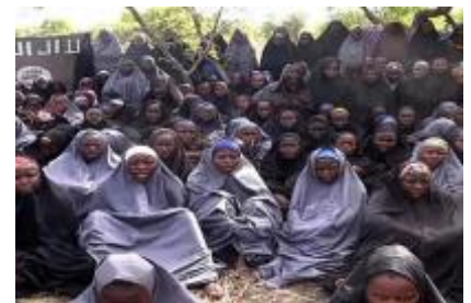
Figuur 11: De ontvoerde Chibok-meisjes

Het moment waarop de internationale alarmbellen pas echt gingen rinkelen, is wanneer Boko Haram strijders in april 2014 meer dan tweehonderd meisjes (figuur 11) ontvoerden bij een school in Chibok 18 . Onbekende gewapende mannen zijn in de nacht de slaapvertrekken van de meisjes ingetrokken, om hen