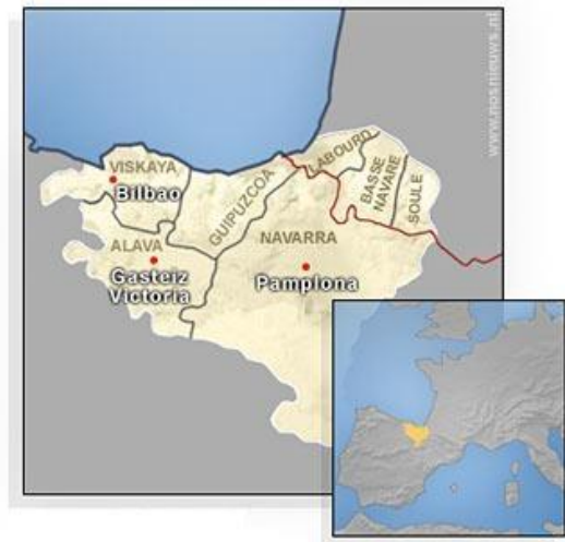
Figuur 1: Baskenland

Zoals op pagina 15 is beschreven gaf de PNV pas laat steun aan de regering. Hierdoor werd daarna de groeiende Baskische autonomie tot een halt geroepen. De republikeinen kwamen echter in 1936 opnieuw aan de macht, waarna het niet lang duurde voordat Franco aan zijn opstand tegen de Republiek begon, en de regering haar belofte van Baskische autonomie niet op tijd waar kon maken. Ondanks dat de Republiek vóór de Burgeroorlog haar beloften niet kon houden bleef de PNV wel aan de kant van de gekozen regering staan. Baskenland werd vervolgens gedeeltelijk