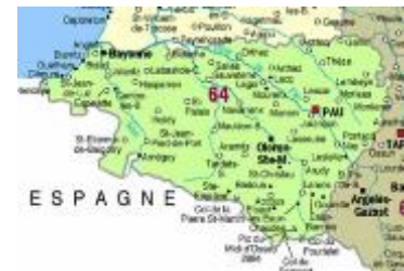
Figuur 2: Frans Baskenland