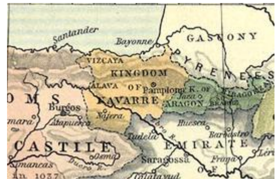
Figuur 3: Het koninkrijk Navarra

Het Baskenland omvat de steden Bilbao, San Sebastian en Pamplona in Spanje, en Biarritz, Hendaye en Bayonne in Frankrijk. Samen komen deze gebieden overeen met het grondgebied van het voormalige Koninkrijk Navarra 8 . In dit koninkrijk werd Baskisch gesproken. De grenzen van dit koninkrijk reken veel verder, maar gebieden waar geen Baskisch werd gesproken vonden zij niet bij hun rijk horen.