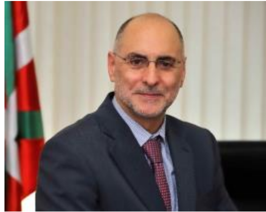
Figuur 5: Rodolfo Ares

Na de hervatting van het geweld eind 2006 en het plegen van verschillende aanslagen kwam de ETA op 5 september 2010 met een nieuw staakt-het-vuren. De ETA beloofde bij dit staakt-het-vuren geen wapens meer te gebruiken in haar strijd voor onafhankelijkheid. Deze verklaring kwam na de arrestatie van een groot aantal ETA-leiders en het oplaaien van het debat binnen de nationalistische gemeenschap over de vraag op wat voor manier de strijd voor onafhankelijkheid in de toekomst gevoerd moest gaan worden. Volgens Rodolfo Ares (figuur 5), de minister voor de Baskische regio, was de verklaring van de ETA om te zoeken naar een democratische manier goed nieuws, maar verwachtte het Baskische volk van de organisatie dat zij definitief de wapens zou neerleggen. Dit staakt-het-vuren werd op 10 januari 2011 gevolgd door een verklaring die de situatie definitief maakte. Zapatero reageerde op deze verklaring door te stellen dat de ETA definitief het geweld moet afzweren en zich totaal op een democratische oplossing van het Baskische conflict moet richten. De Baskische bevolking keerde zich tegen het geweld, omdat ze niet nog meer slachtoffers wilden dan dat er al waren, zoals bijvoorbeeld de slachtoffers van het bombardement op Guernica. 32